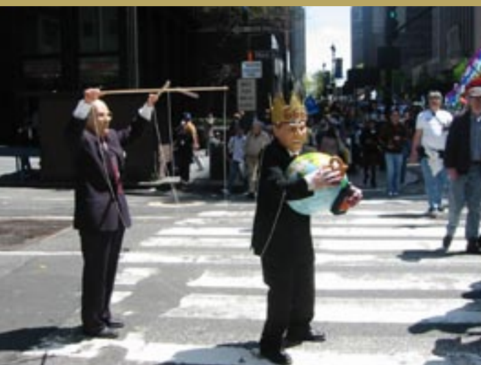
gatugycklare var en del i den stora demonstrationen i Manhattan och skulle föreställa Bush till höger och vicepresident Cheney till vänster. Man vill här visa att Cheney är som håller i trädarna och styr Bush.