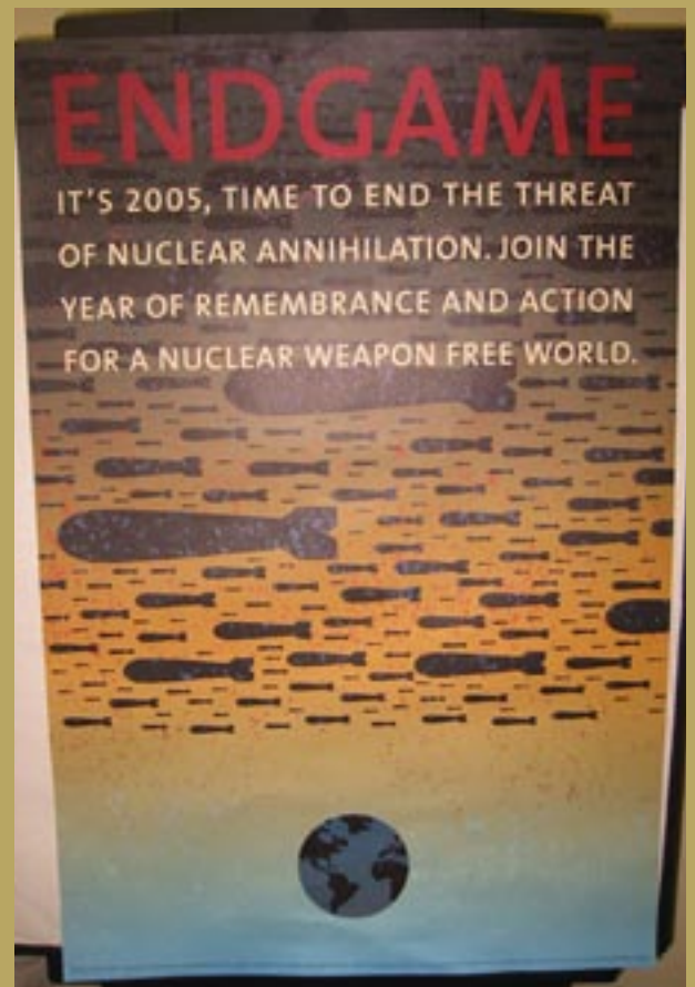
Talande affisch vid NPT-mötet.