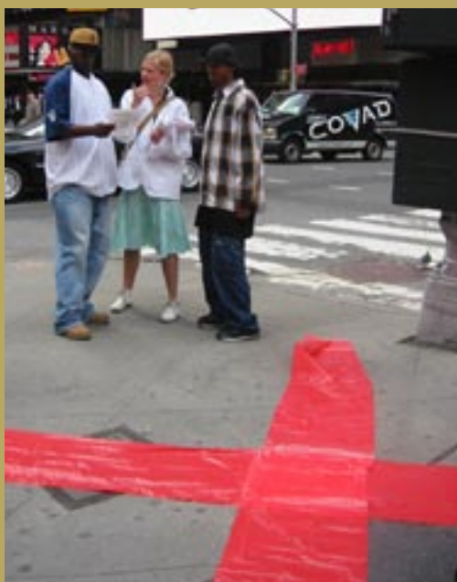
Studenter i Target-projektet. Vad händer om en Hiroshima-bomb slår ner just här? Förbipasserande informeras på Times Square, alldeles där folk skulle köpa sina teaterbiljetter. Det blev tillfällen till många diskussioner med intresserade människor som passerade under lunchen. Läs också på sid 9.