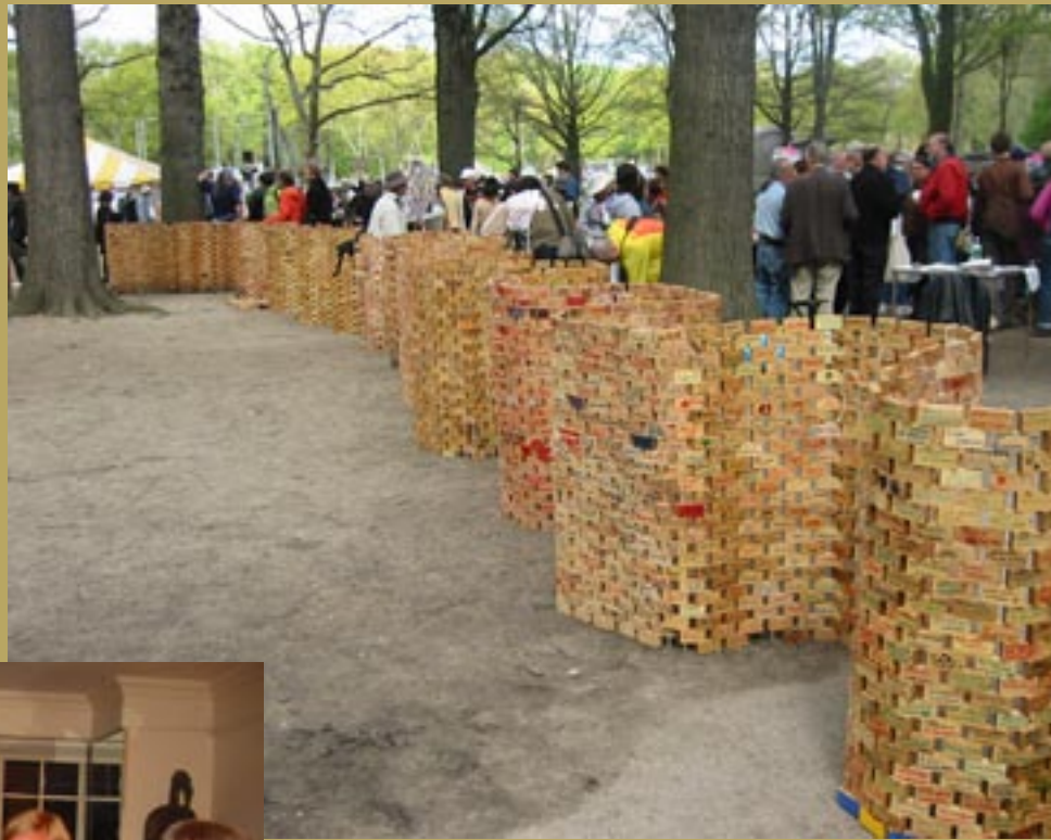
Den ringlande internationella skyddsmuren mot kärnvapen byggd av en mängd klossar med personliga meddelanden.