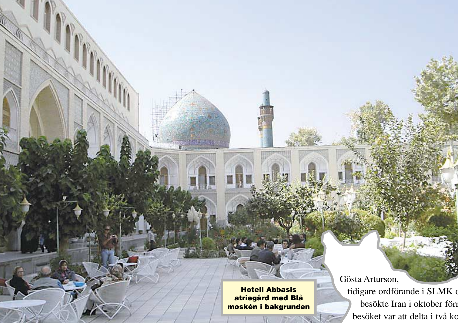
Hotell Abbasis atriegård med Blå moskén i bakgrunden