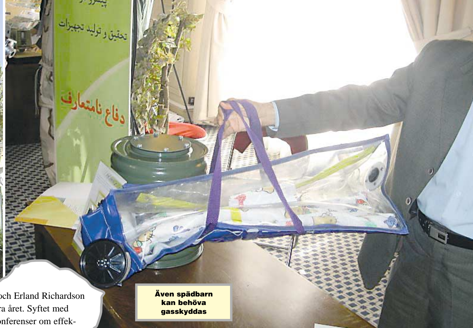
Även spädbarn kan behöva gasskyddas