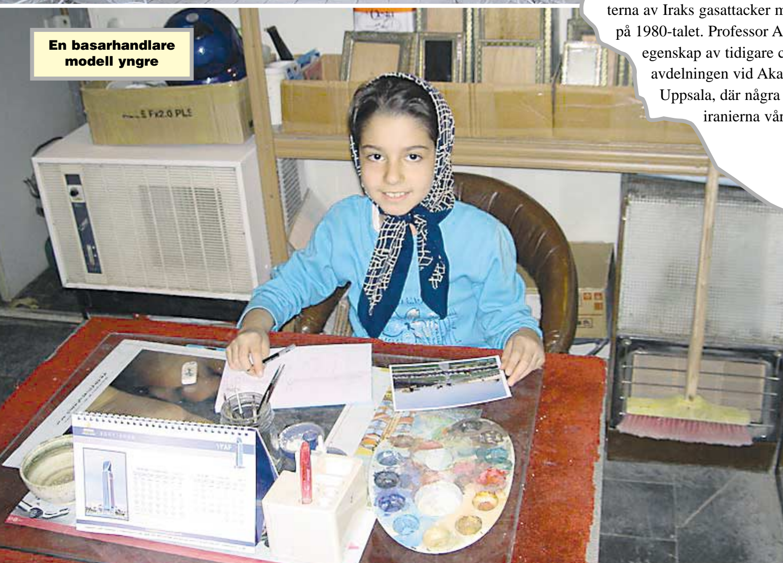
En basarhandlare modell yngre