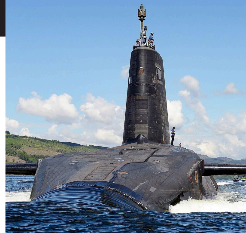
↑ Storbritannien har ständigt en patrullerande kärnvapenbestyckad ubåt av Vanguard-klass till havs.

I byggandet av Storbritanniens nya kärnvapenarsenal är flera företag involverade, bland annat Babcock International, BAE Systems, Northrop Grumman och Rolls Royce. Det brittiska försvarsdepartementet ska 2023 ha rapporterat att dessa företag försöker påverka politiken och regeringens beslutsfattande. Storbritannien kräver inte att lobbyister ska